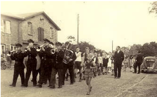
Das Vogelschießen hat eine lange Tradition: Umzug durch den Ort 1948

9. Juli, Vogelschießen: ein Dorffest für alle Einwohner.