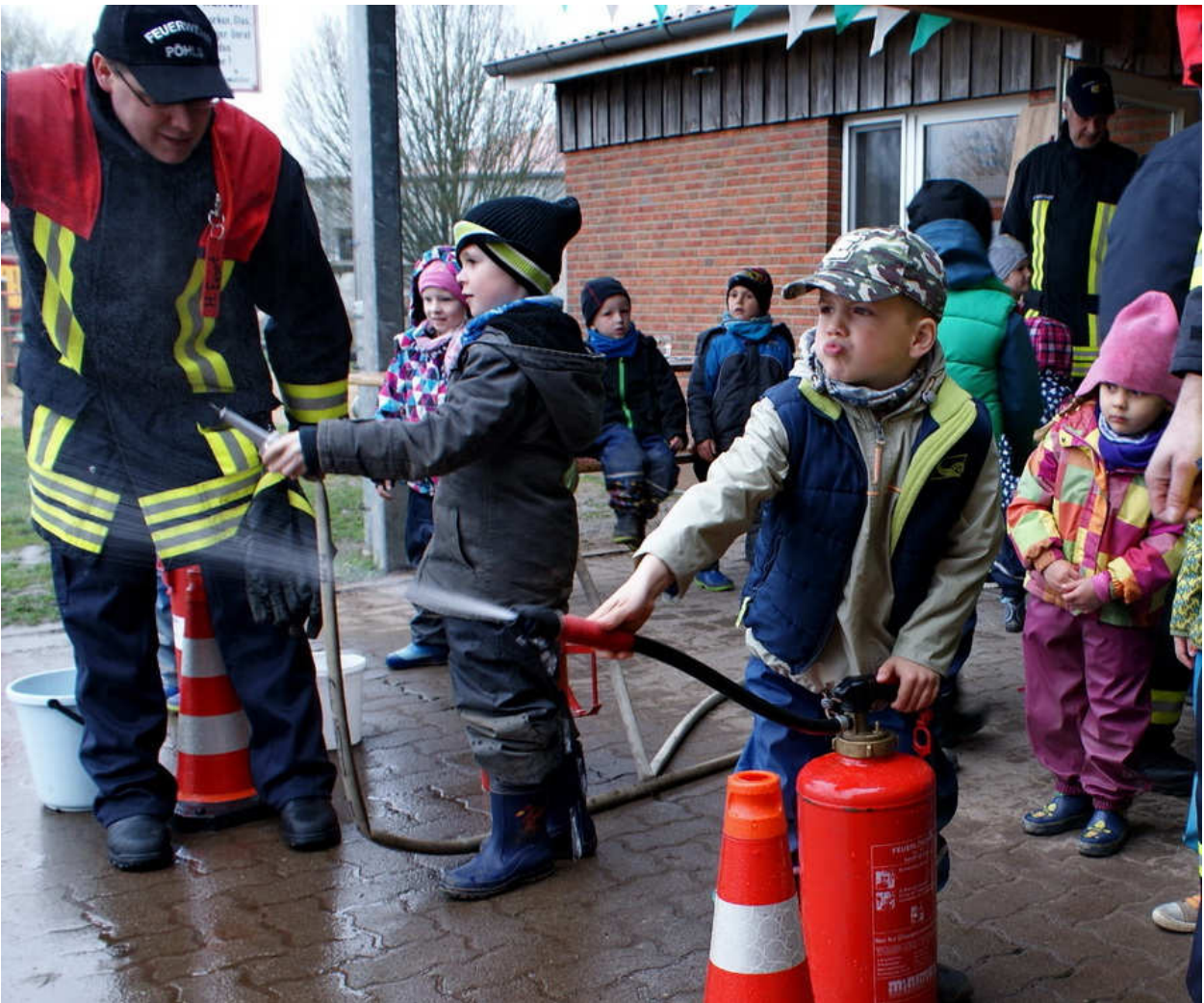
Brandschutzfrüherziehung im Kindergarten „Gänseblümchen e.V.“