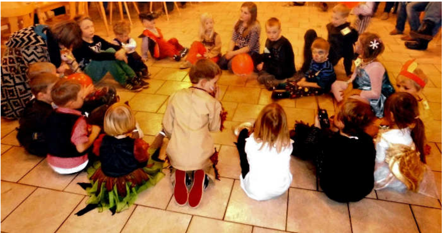
Kinderfasching in Rehhorst