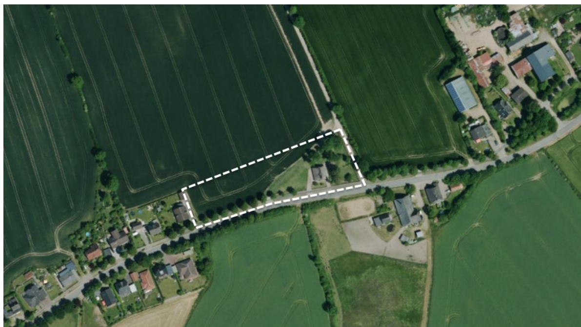
Abb.: DA Nord

Im Westen grenzt die bebaute Ortslage Steinfeld an das Plangebiet an. Direkt nördlich, südlich und östlich des Plangebietes werden die benachbarten Flächen landwirtschaftlich genutzt. Weiter östlich setzt sich nördlich der Kreisstraße die Straßenrandbebauung fort. Südöstlich befindet sich eine Reitanlage.